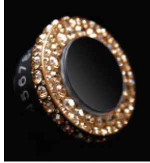
Crystal Golden Shadow